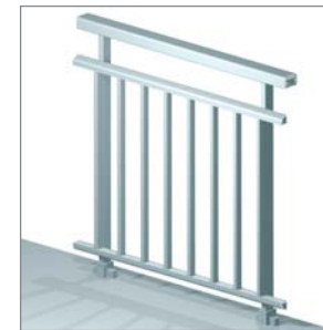
Dimensión máxima entre pilastras